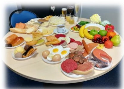
Banque d'aliments factices mis à disposition des équipes d'ETP