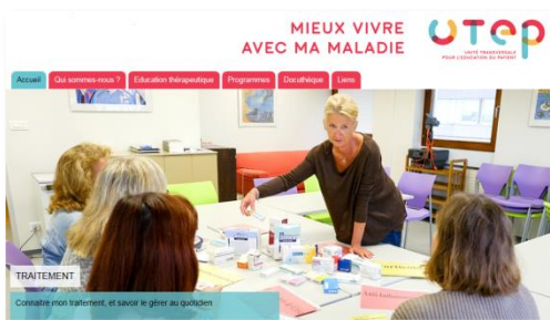
Naissance du site

Notre objectif est de transmettre, valoriser, diffuser l'ETP largement à tous les publics qu'ils soient médicaux, paramédicaux, travailleurs sociaux mais aussi les patients et leur entourage.